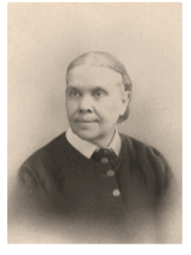
Елена Уайт, фотография была сделана за полгода до смерти Джеймса Уайта

Джеймс Уайт умер спокойно без борьбы или стонов.