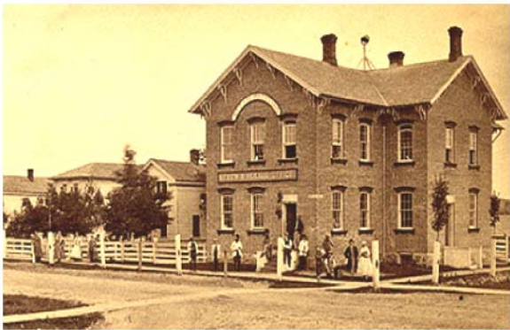
Издательский дом «Ревью энд Геральд» в Батл-Крике

В понедельник 1 августа 1881 г. у Джеймса Уайта начался сильный озноб. Во вторник,