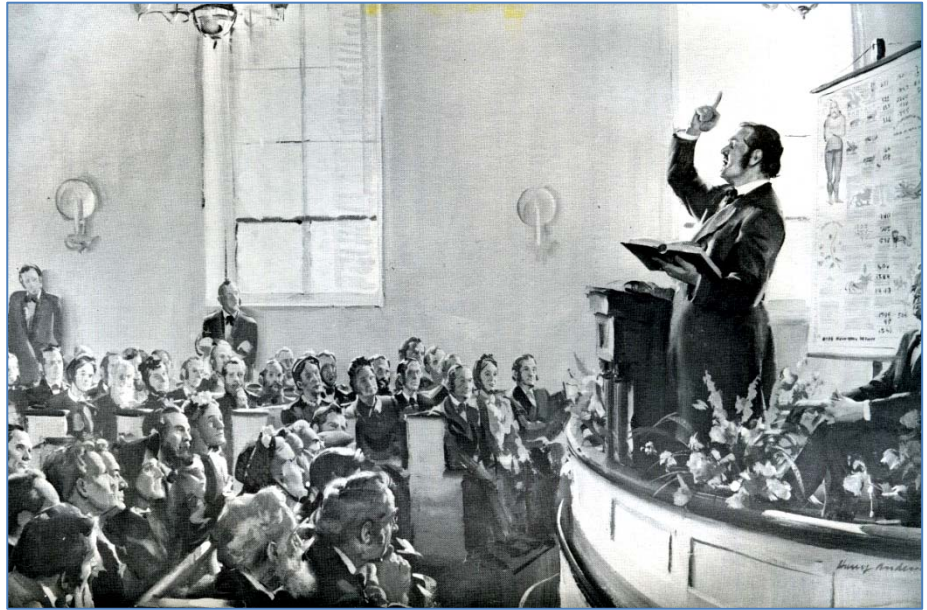
Уильям Миллер проповедует

Елена Уайт желала получить крещение. Служитель ее церкви сказал, что кропление несколькими каплями воды будет достаточно. Но Елена настаивала на том, что ее греховная жизнь должна быть полностью погружена в водной могиле. После некоторых колебаний служитель согласился крестить Елену так, как она этого хотела.